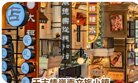
千古情嶺南文旅小鎮