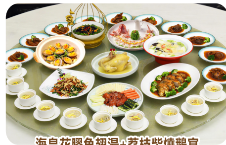
海皇花膠魚翅湯+荔枝柴燒鵝宴