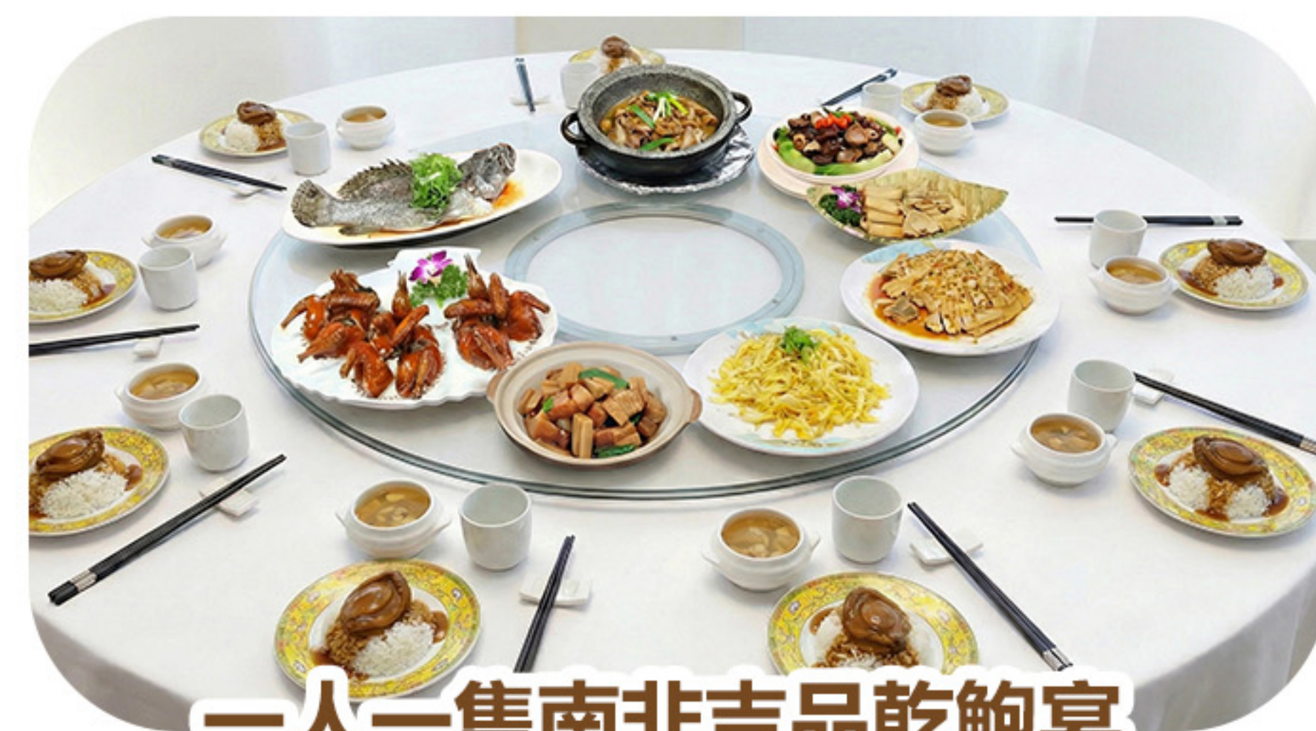
一人一隻南非吉品乾鮑宴