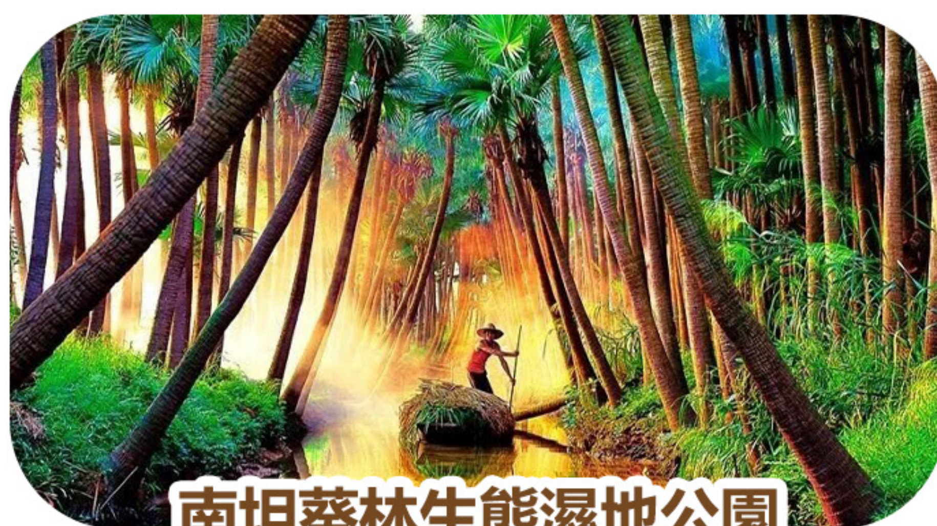
南坦葵林生態濕地公園