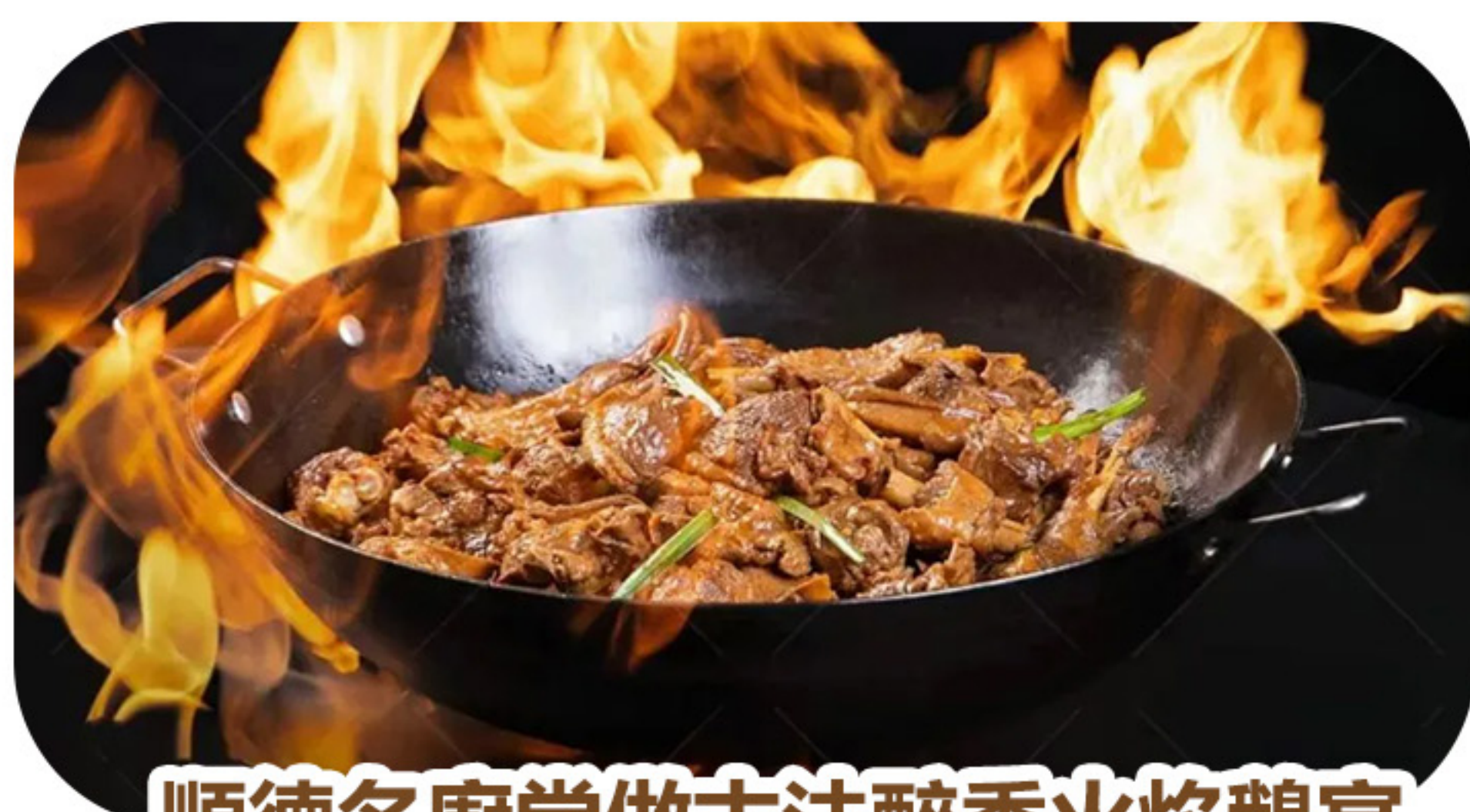
順德名廚堂做古法醉香火焰鵝宴