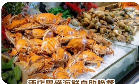
酒店豐盛海鮮自助晚餐