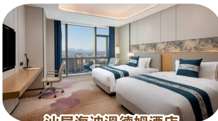
汕尾海迪溫德姆酒店