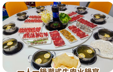
一人一鍋潮式牛肉火鍋宴