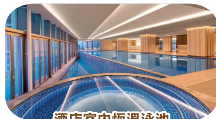
酒店室內恆溫泳池