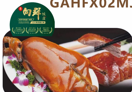
粵·向群飯店~35年老字號粵菜宴