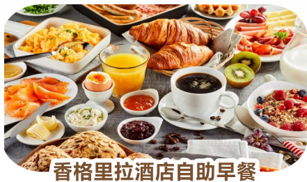
香格里拉酒店自助早餐