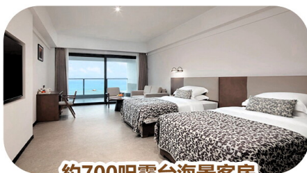
約700呎露台海景客房