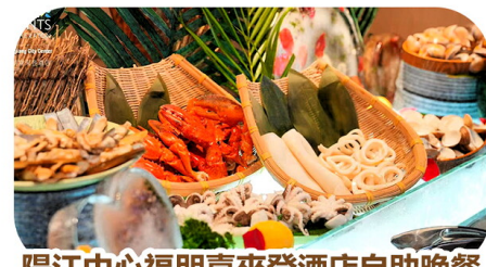
陽江中心福朋喜來登酒店自助晚餐