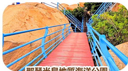
那琴半島地質海洋公園