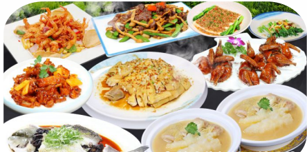
(位上)翅湯雲吞煲大花膠+每位半隻紅燒石岐乳鴿