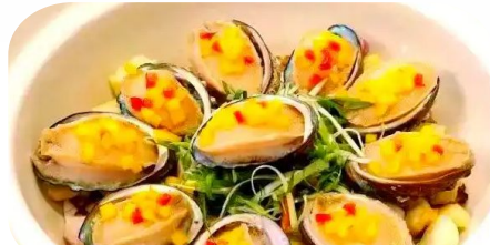
黃金醬焗鮮鮑魚+鮑汁紅腰豆燴海參宴