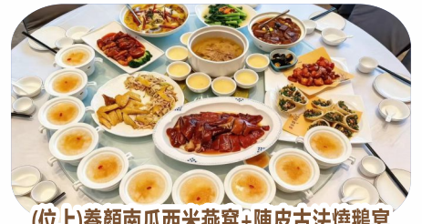
(位上)養顏南瓜西米燕窩+陳皮古法燒鵝宴