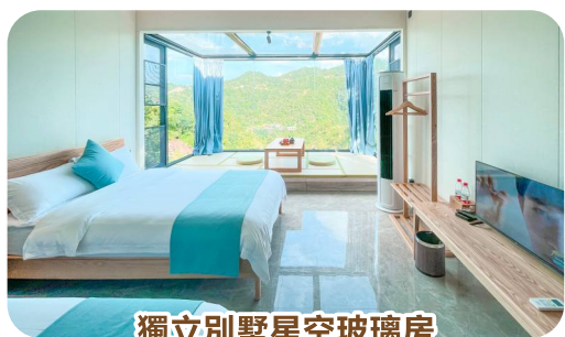
獨立別墅星空玻璃房