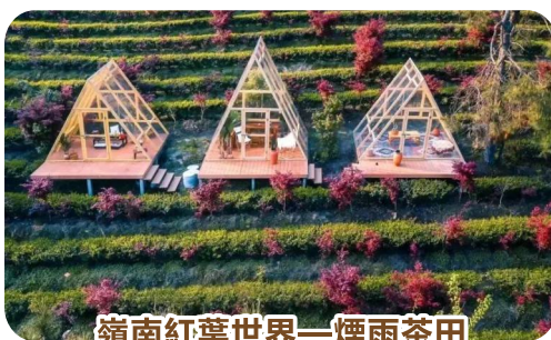
嶺南紅葉世界—煙雨茶田