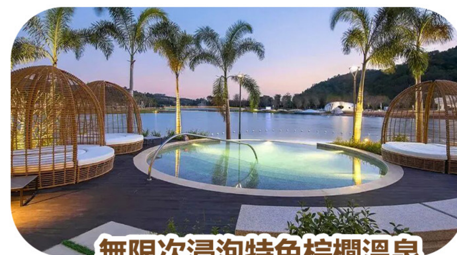
無限次浸泡特色棕櫚溫泉