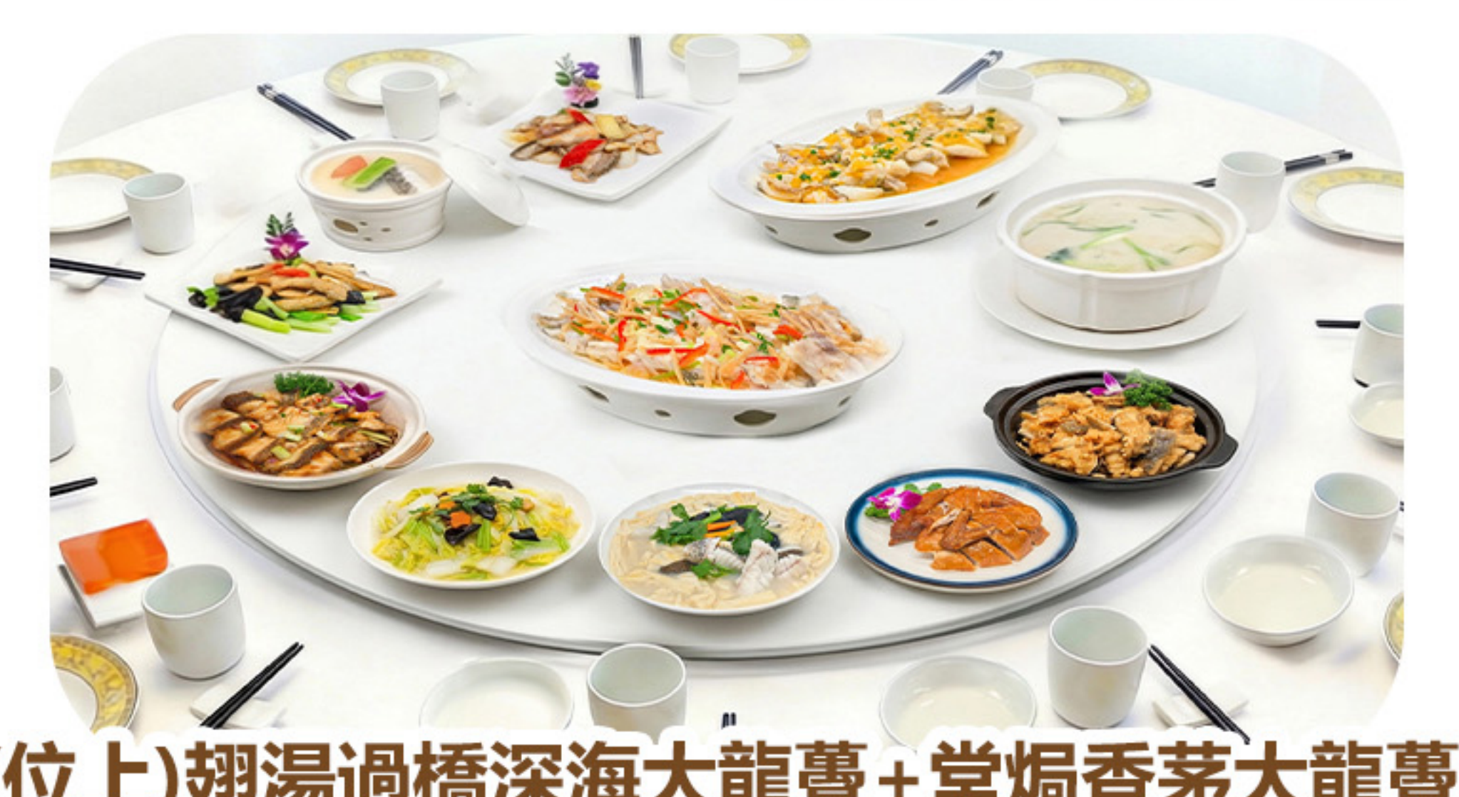
(位上)翅湯過橋深海大龍躉+堂焗香茅大龍躉