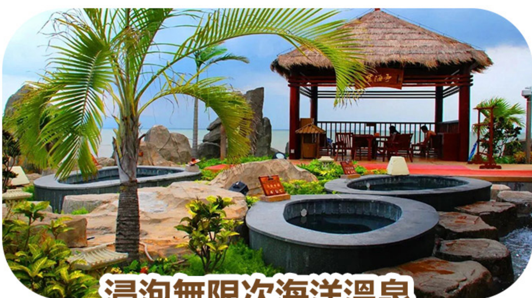
浸泡無限次海洋溫泉