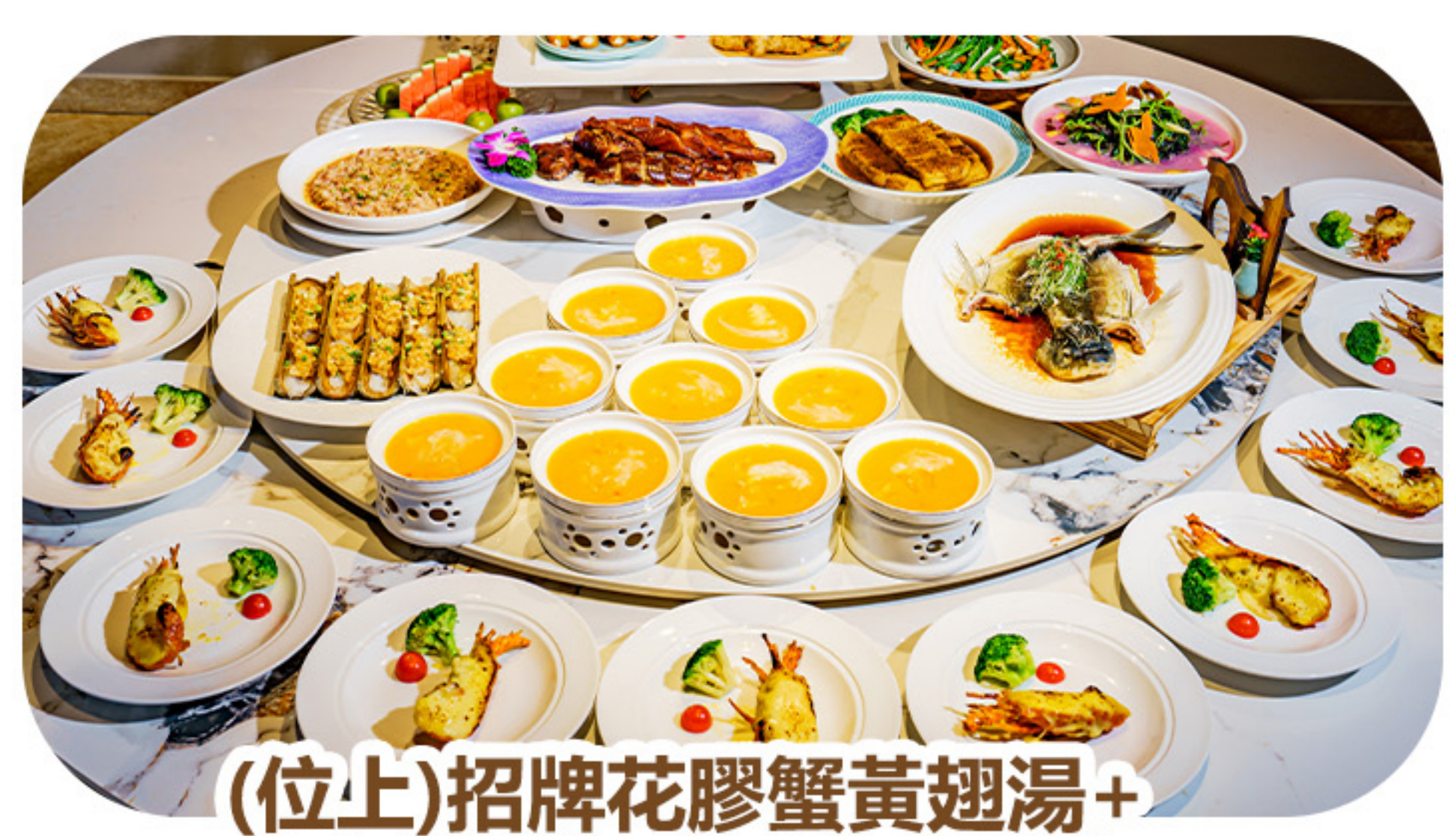
(位上)招牌花膠蟹黃翅湯+芝士焗青龍(位上每人半隻)