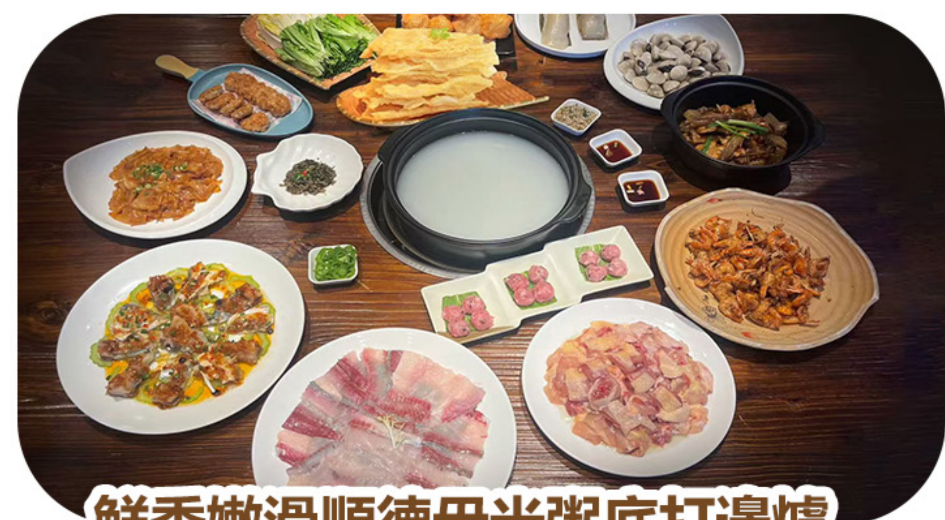
鮮香嫩滑順德毋米粥底打邊爐