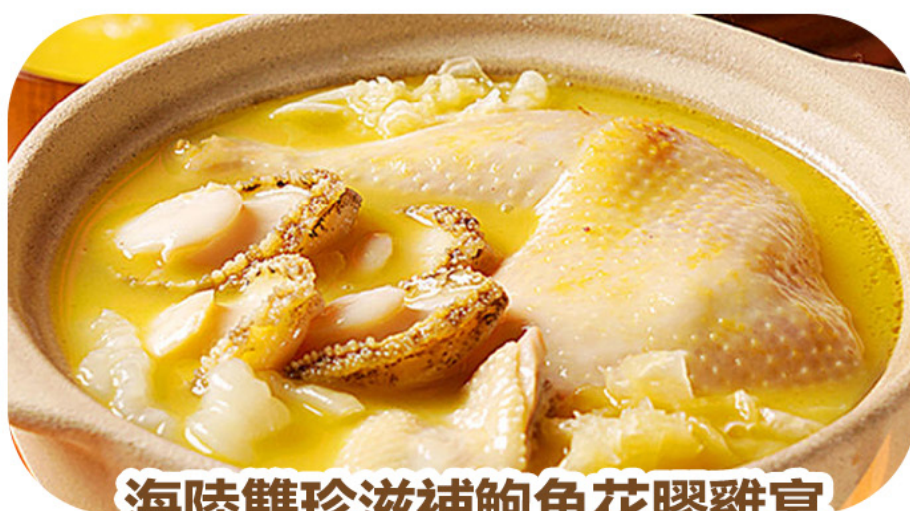
海陸雙珍滋補鮑魚花膠雞宴