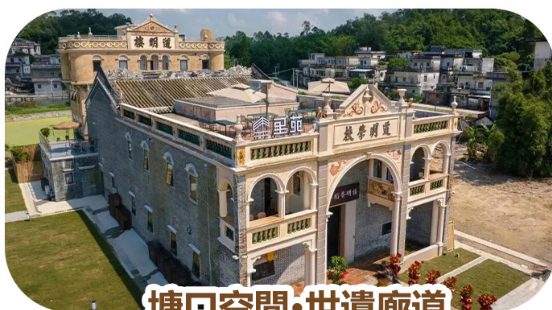
塘口空間·世遺廊道