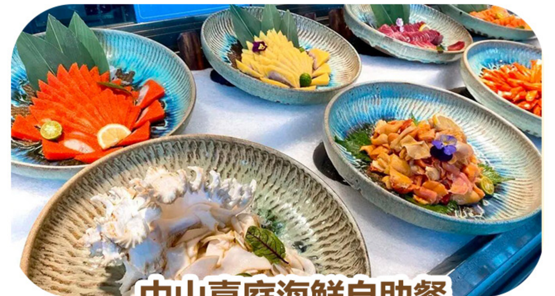
中山喜庭海鮮自助餐