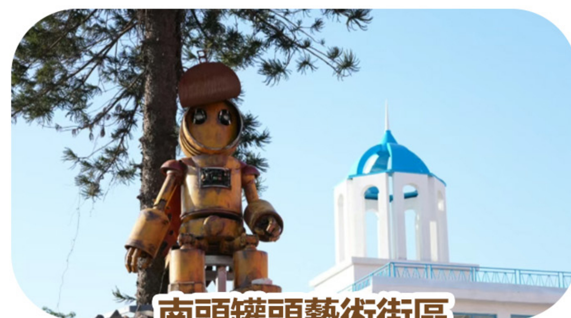
南頭罐頭藝術街區