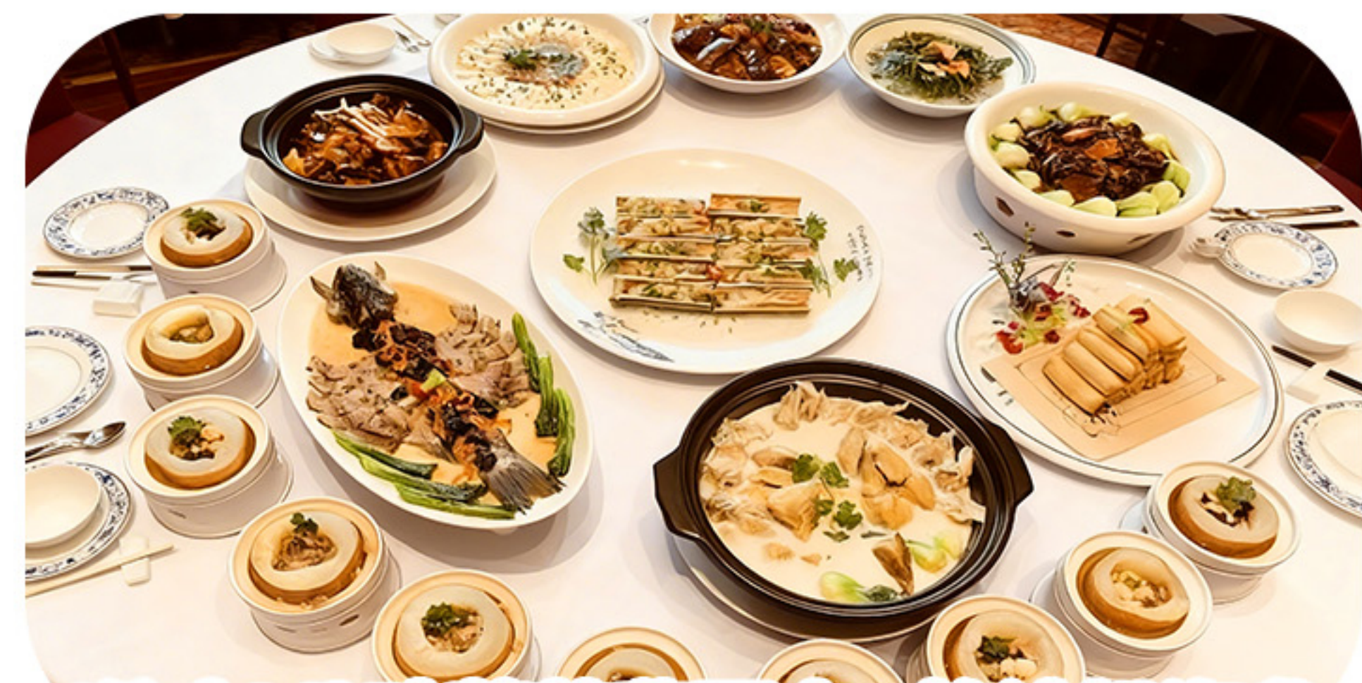
(位上)八珍薈萃翡翠盅+鮑汁扒海參+雲吞牛奶浸雞宴