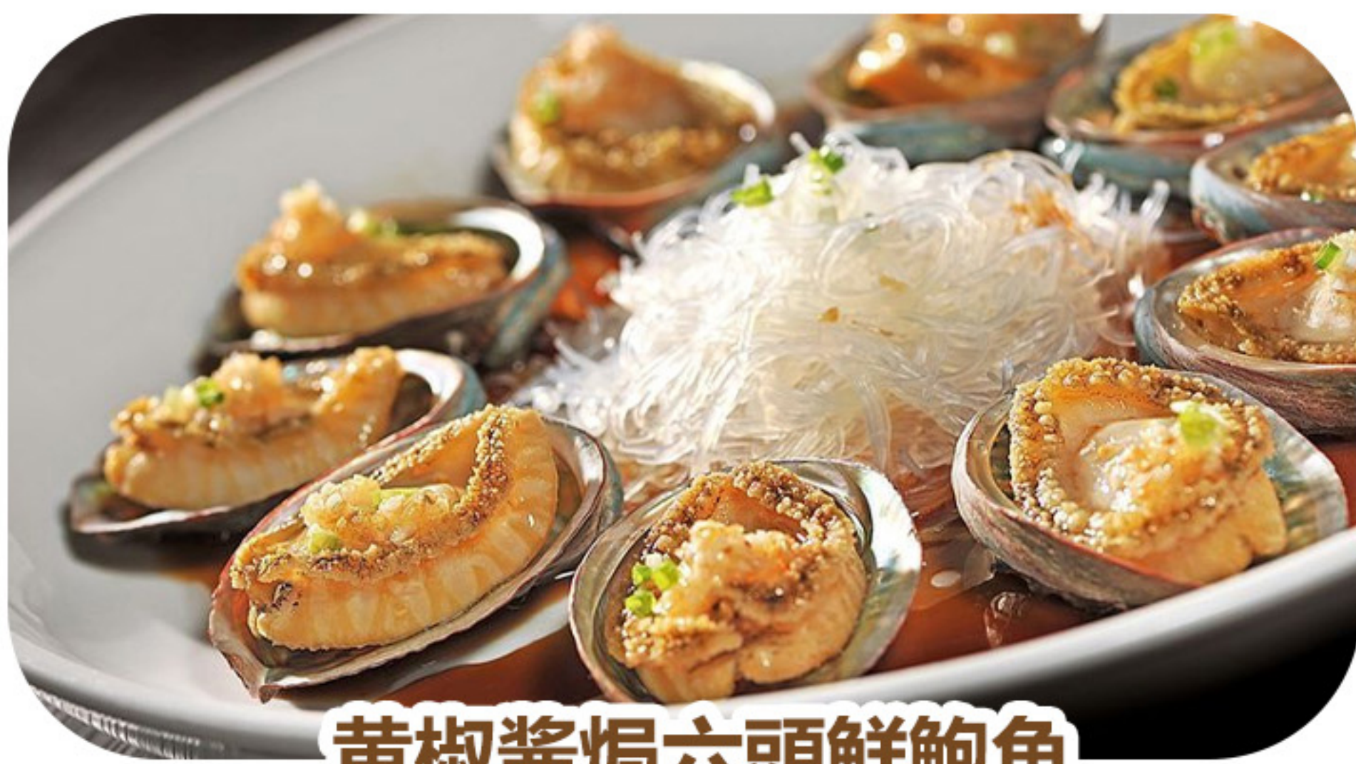
黃椒醬焗六頭鮮鮑魚