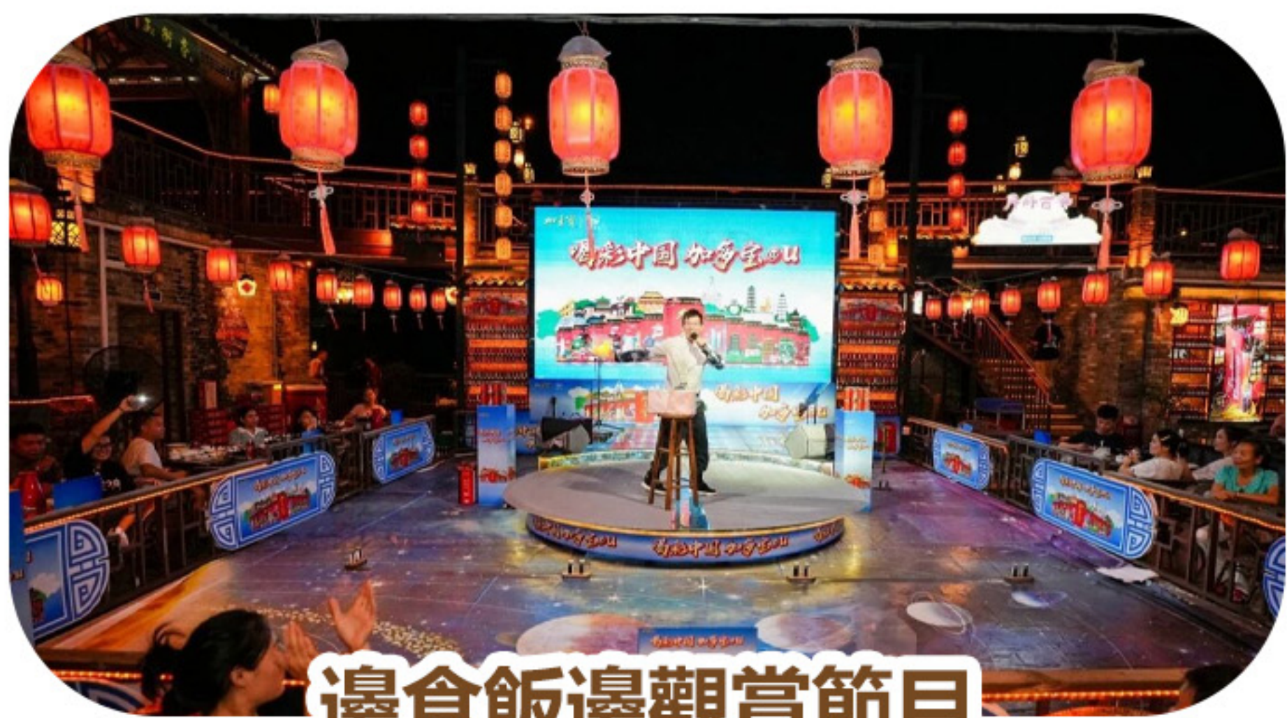
邊食飯邊觀賞節目