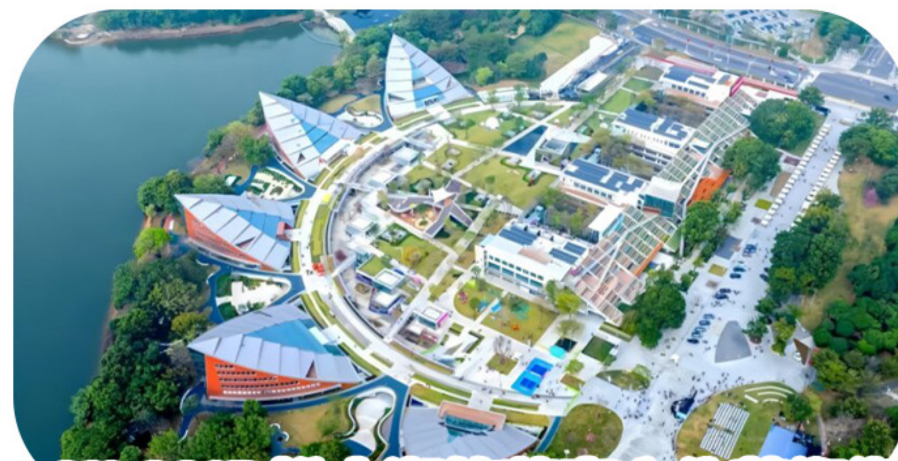
ULAND松山湖悠蘭裏文化藝術街區